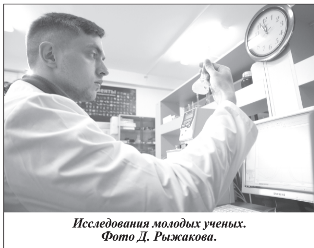
Исследования молодых ученых.

поддержки молодых ученых - кандидатов наук в области «Химия, новые материалы и химические технологии».