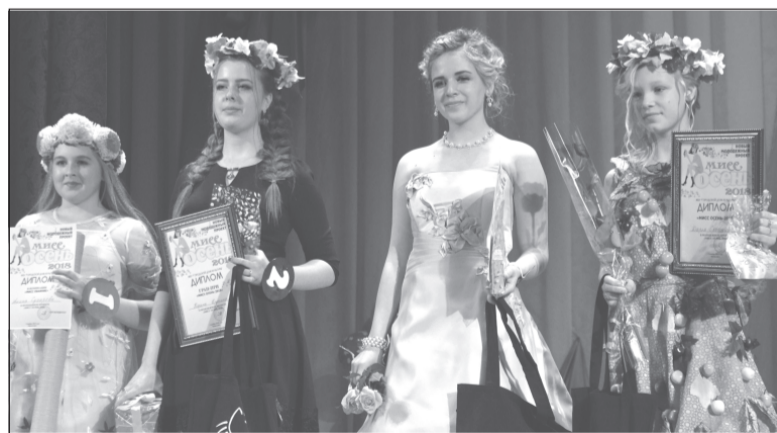
Дерзкие, милые, романтичные...