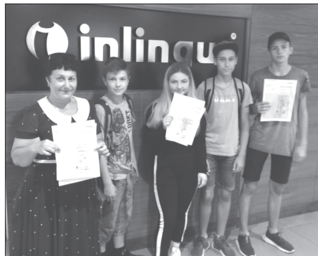
Получили сертификаты о прохождении обучения.

Учеба на Мальте проходит в школе Inlingua. В нее народ приезжает со всего света – Европы, Японских островов, Южной Америки. Ученики распределяются по группам в соответствии с результатами теста: хорошо сдал его – в