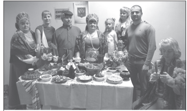
Русское подворье, село Новое.