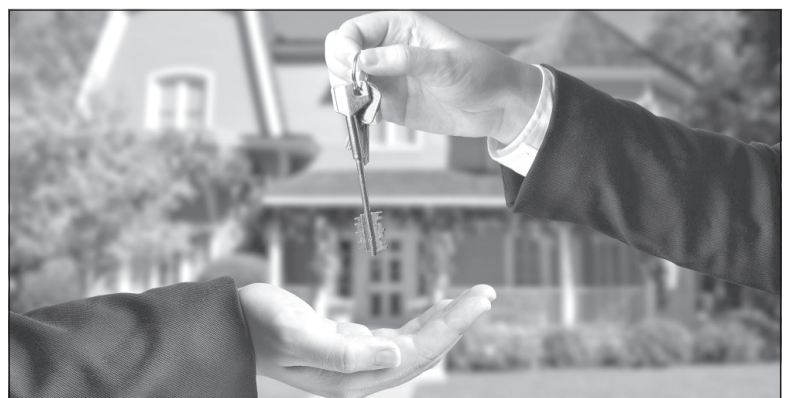
При операциях с недвижимостью следует поближе познакомиться с объектом покупки.

По материалам Управления Росреестра по Ивановской области.