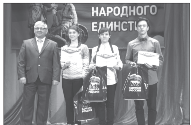
Победители конкурса сочинений о комсомоле.