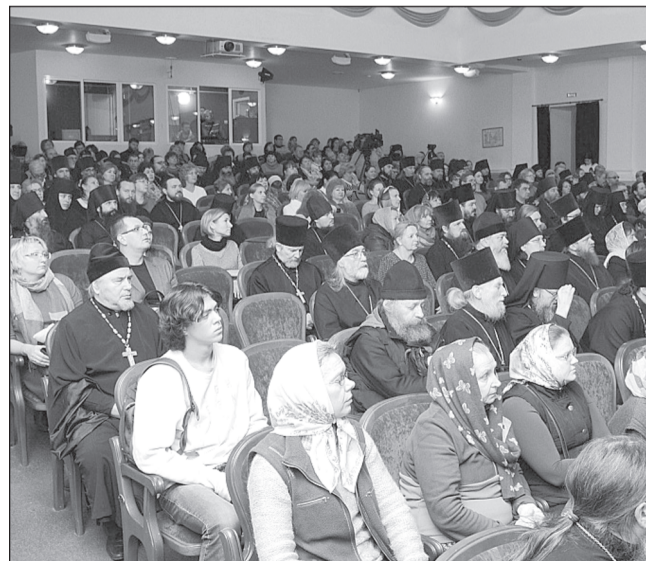
Участники региональных Рождественских образовательных чтений.

Отметим, первые Рождественские чтения прошли в Ивановской области в 1993 году. Мероприятие направлено на духовно-нравственное просвещение общества, осмысление проблем науки и культуры с точки зрения православного мировоззрения, расширение сотрудничества церкви и государства в области образования.