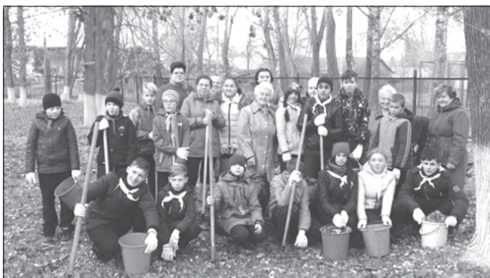
Благотворительная акция для ветеранов.

Нынешний год объявлен Годом добровольца, статус волонтера поднят на новую высоту. Стать волонтером может любой гражданин, но нельзя этому принудить, как нельзя заставить быть добрым и отзывчивым.