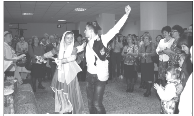
Дагестанский танец исполняют учащиеся школы № 1.

Завершающим аккордом концерта стало выступление академического народного хора «Вдохновение» из Иванова. О высоком уровне исполнительского мастерства гостей говорил всего один лишь факт: свой концерт они начали с произведения С.Рахманинова.