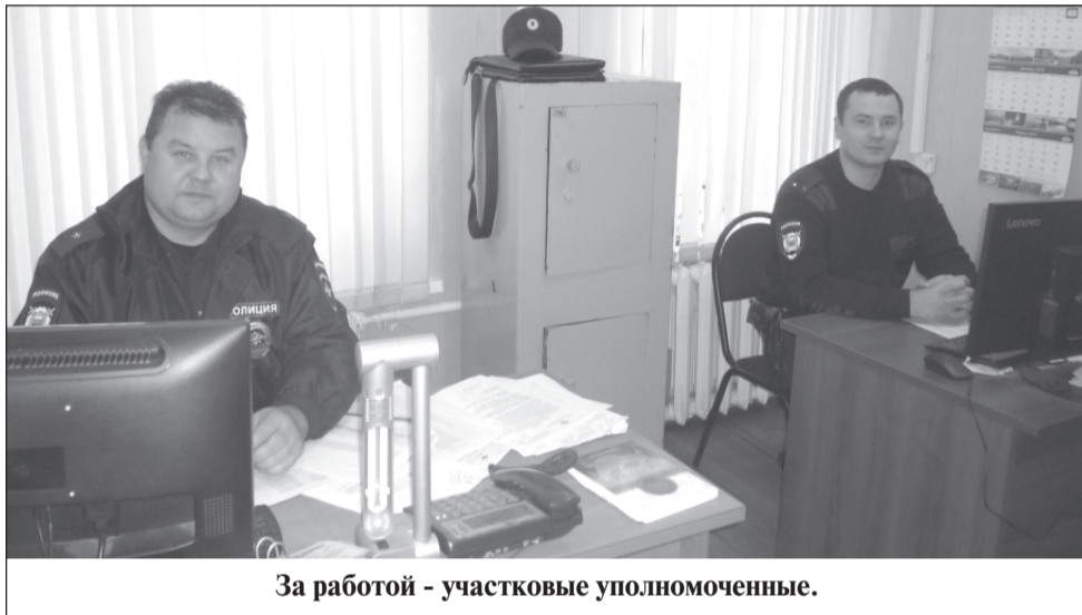
За работой – участковые уполномоченные.

средством мобильной связи: несмотря на проведение профилактических мероприятий, на конец третьего квартала зарегистрировано их 14, причём потерпевшим причинён серьёзный материальный ущерб. Следует отметить, что такие преступления представляют определённую сложность для их раскрытия. На сегодняшний день только пять из них расследовано и направлено в суд, а это 25% от общего числа. Данный показатель значительно лучше среднеобластного.