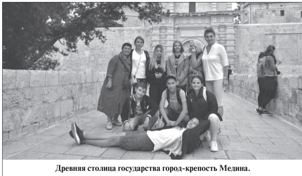
Древняя столица государства город-крепость Медина.

В общем, все в ходе этого краткосрочного пребывания играло на то, чтобы чувство самосохранения заставляло использовать разговорной англ-