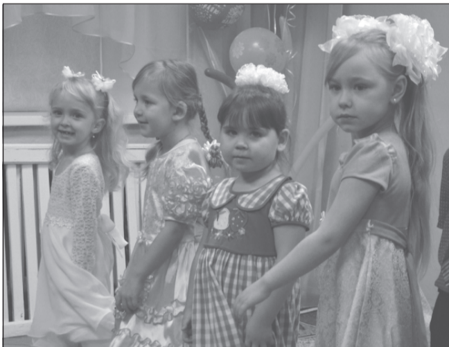
«Цветочки» из «Колокольчика».

50 лет – срок немалый. Гости, приглашённые на торжество, с интересом разглядывают фотографии на стенах – чёрно-белые и цветные. На них – выпускники «Колокольчика». То и дело слышится: «Вот мой Серёжа! А вот моя Оля!». Сколько же поколений дошколят подросло здесь! Ело на завтрак геркулесовую кашу, укладывалось спать, распевало весёлые песни, сидя на тех маленьких стульчиках, расписанных ягодами земляники и красной смородины... А сейчас стульчики займут нынешние воспитанники детского сада, и всё начнётся!