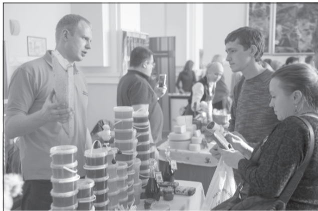
На выставке продукции предприятий перерабатывающей промышленности.