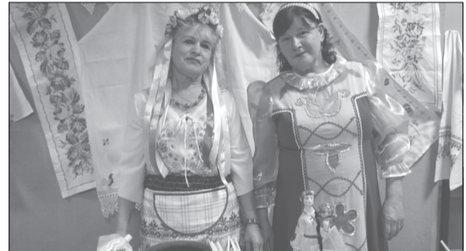
Новички праздника - участницы хора «Приволжские зори».