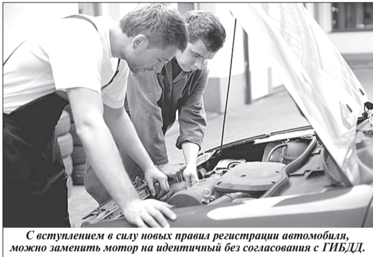
С вступлением в силу новых правил регистрации автомобиля, можно заменить мотор на идентичный без согласования с ГИБДД.